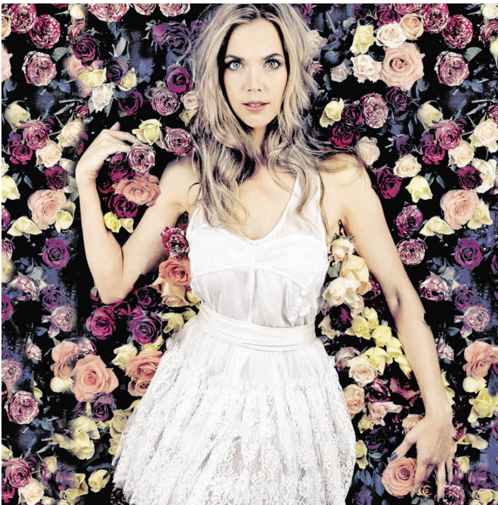
Mojca Erdmann ist einer der Stars bei „Beyond Recall“.