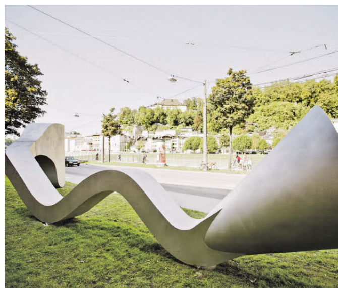
10. Erwin Wurm: „Gurken“, 2011.