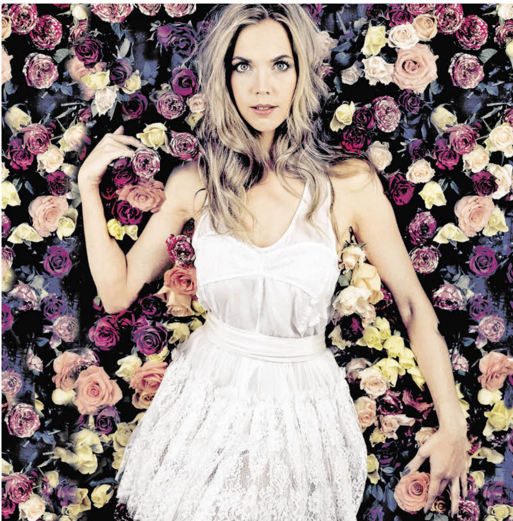
Mojca Erdmann ist einer der Stars bei „Beyond Recall“.