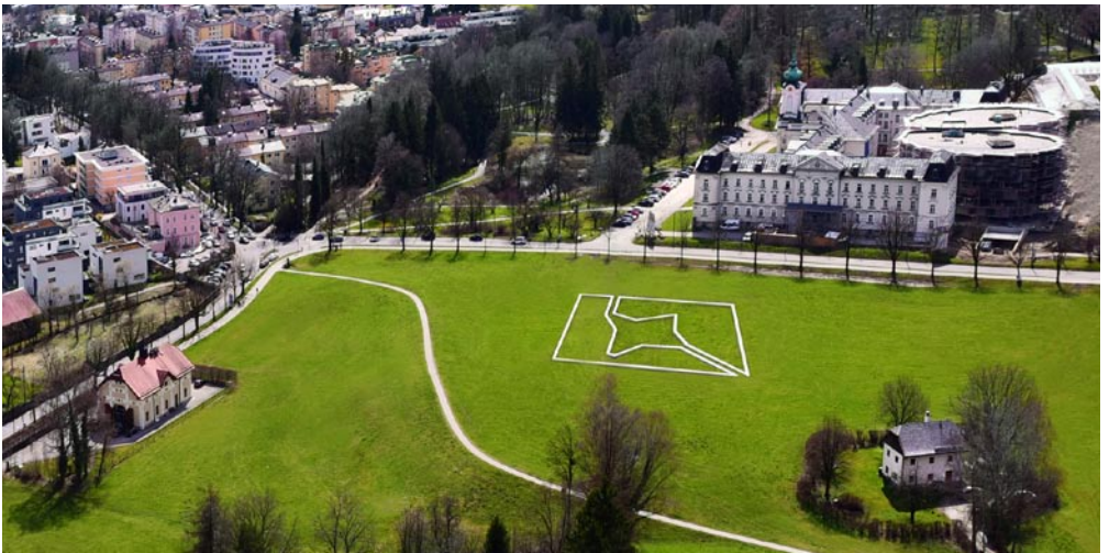
Paul Wallach, Down to the Ground, 2018

Paul Wallach deliberately lets an immense star fall into the landscape. Long rows of white concrete blocks extend across an area measuring 40x45 meters. Only when viewed from a bird's eye perspective, from the Hohensalzburg Castle, does the installation start to take shape, and the geometric composition reveals itself to be a four-pointed, star-shaped structure. Universal spatial conceptions are inverted as the star shines upwards from the ground.